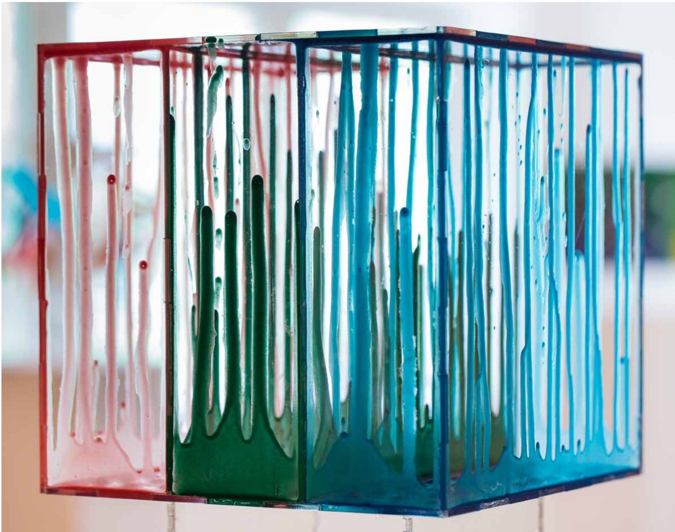
Gravitacijski prostorni crteži / Gravitational Spatial Drawings pleksiglas, epoksid / plexiglass, epoxide, 20x20x20 cm, 2017., detalj / detail