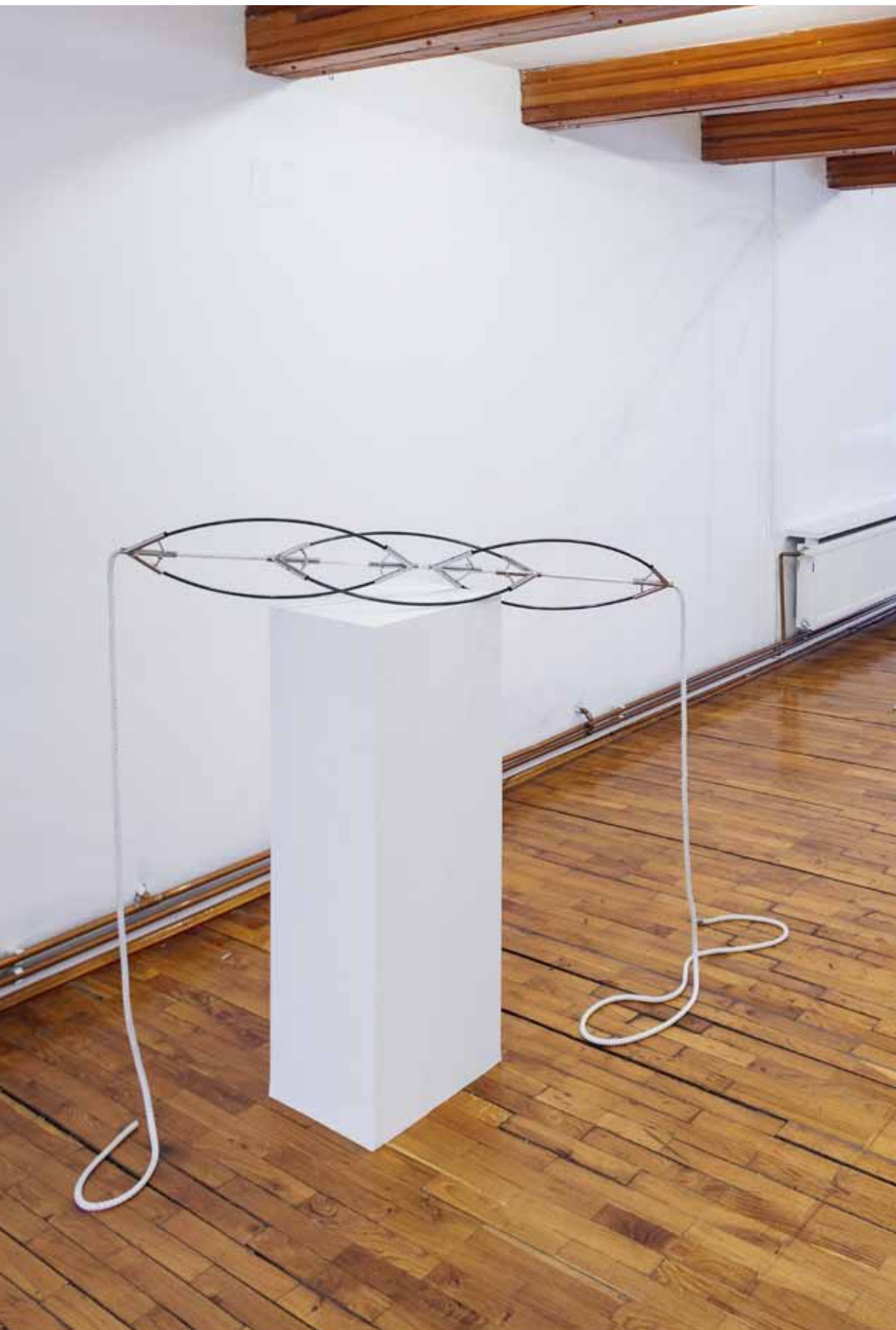
Tri nade ili negiranje gravitacije / Three Hopes or the Denial of Gravity metal, uža / metal, rope, dimenzije promjenjive / variable dimensions, 2017.