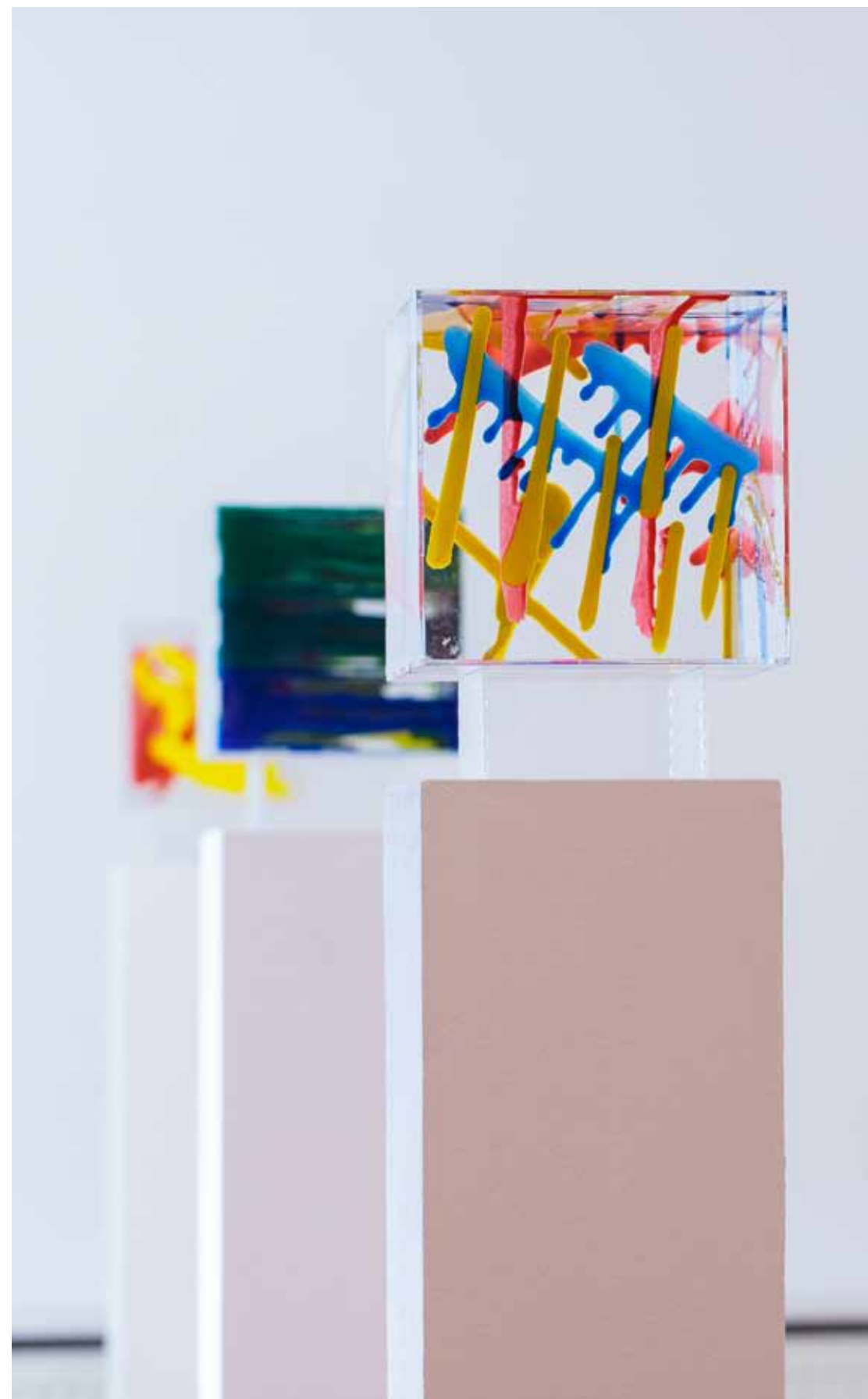
Gravitacijski prostorni crteži / Gravitational Spatial pleksiglas, epoksid / plexiglass, epoxide Drawings, 20x20x20 cm, 2017. detalj / detail