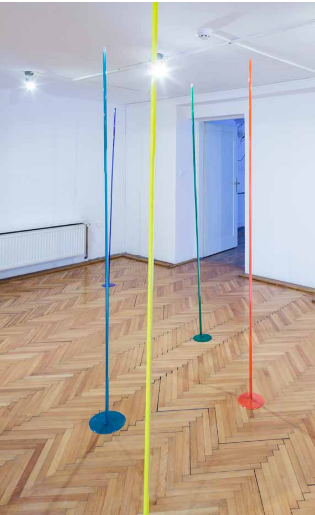
Kapi / Drops epoksid, pleksiglas / epoxide, plexiglass, dimenzije promjenjive / variable dimensions , 2017.

gravity. He chooses pure colors of the rainbow spectrum and pours them onto the plexiglass faces, allowing them to find their way by themselves, creating a kind of gravitational picto-drawing. He thus links the constructional principles used by Richter in the construction of cubes to gravitational drawings that are a fruit of chance and play.