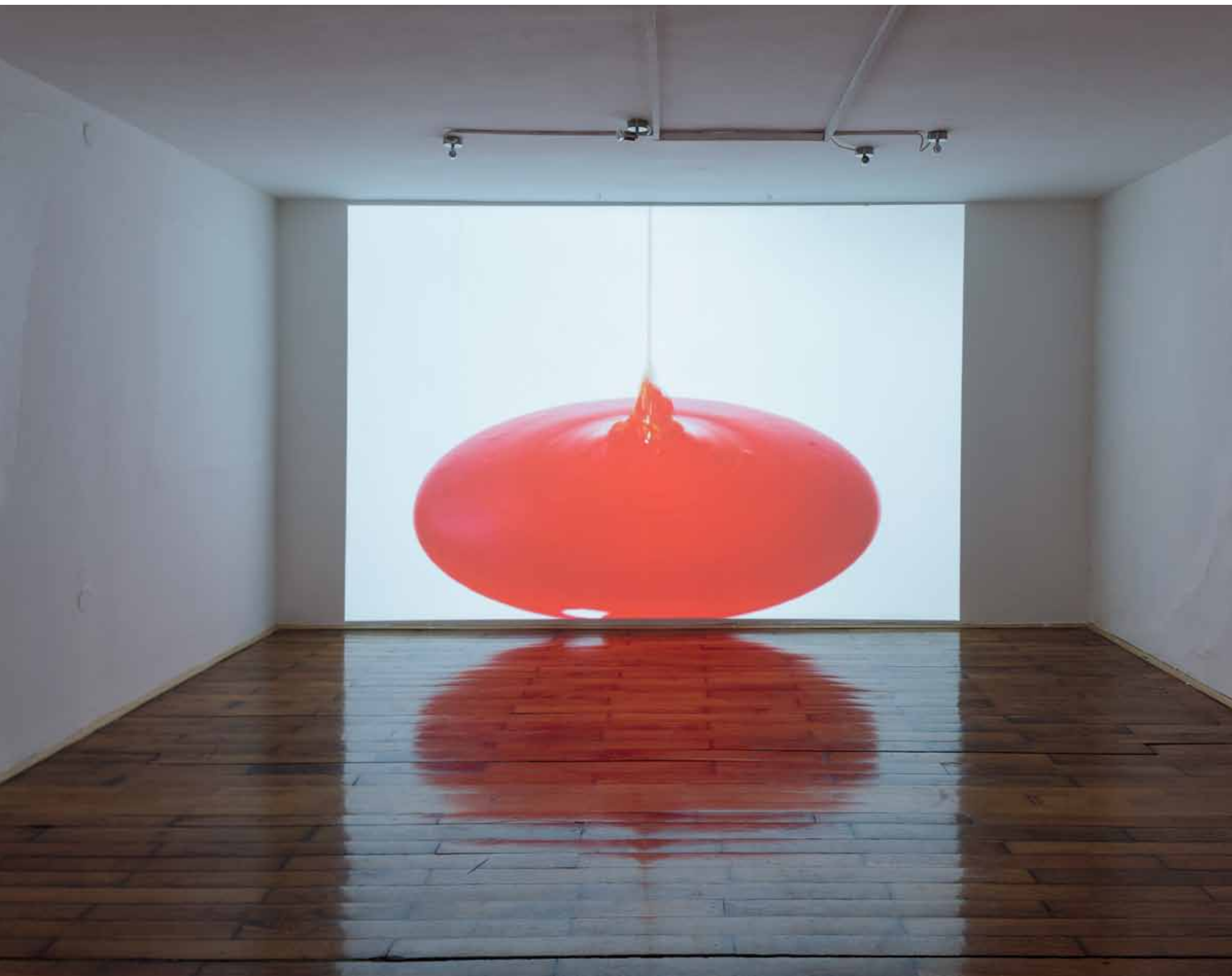
Duga / Rainbow video, bez zvuka / without sound, 6'48", 2017.