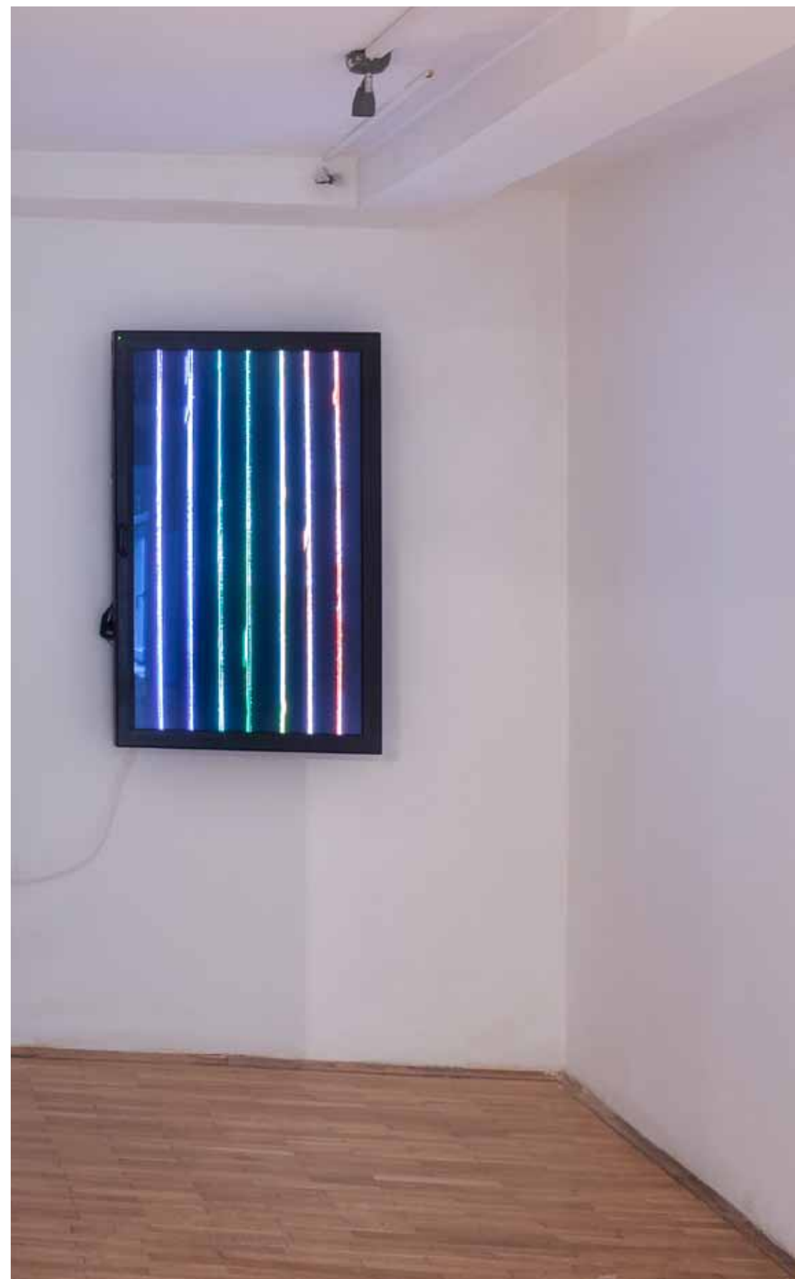
Kapi / Drops video, bez zvuka / without sound, 5'40", 2017.