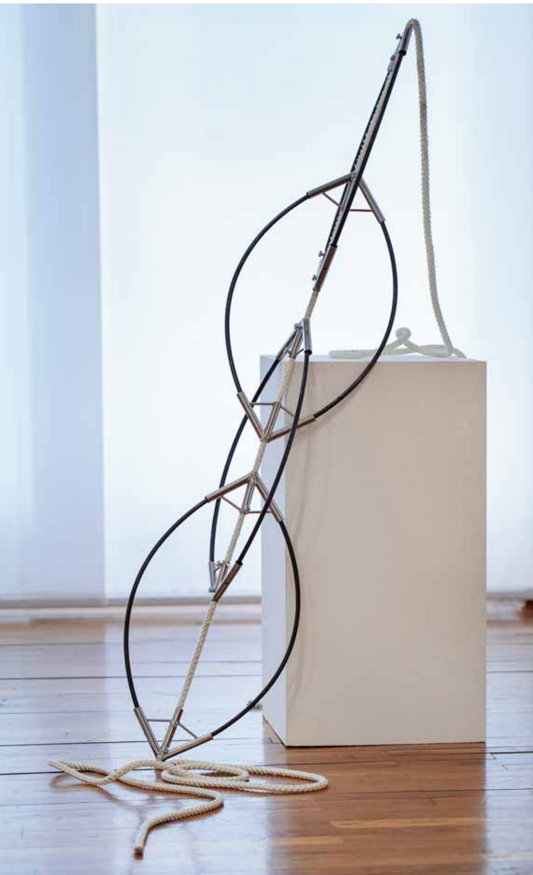
Tri nade ili negiranje gravitacije / Three Hopes or the metal rope / metal, rope, dimenzije promjenjive / variable dimensions, 2017. detalj / detail

toga vremena 5 . „Ta skulptura može poprimiti mnogo likovnih, dimenzijskih, tehničkih, značenjskih varijanata. Ona upravo govori o mogućnosti da se drevni problemi rješavaju na drugi način. Ovo je zapravo fundamentalno pitanje“ 6 . Tri nade ili negiranje gravitacije“ Alema Korkuta također se bave pitanjem anti-gravitacije, ali sada upotrebom podatnog materijala – konopa. Napinje konop pomoću adiranja lukova i udlaga te stvara objekt iznimne vizualne dinamike. Ipak, i ovdje prepoznajemo gravitacijski crtež kojeg stvara konop na krajevima objekta s kojih nehajno pada. Korkutova instalacija „2012“, nastala potaknuta proročanstvima o krah u svijeta 2012. godine, također koristi napetost elemenata kao formalnu, ali i psihološku komponentu. Posjetitelj se nalazi pred nišanom pravilno poredanih i napetih praćaka, što izaziva nelagodu i uznemirenost, unatoč umjetnikovoj želji da se na duhovit način obračuna s mehanizmima generiranja straha kao ljudske umotvorine.