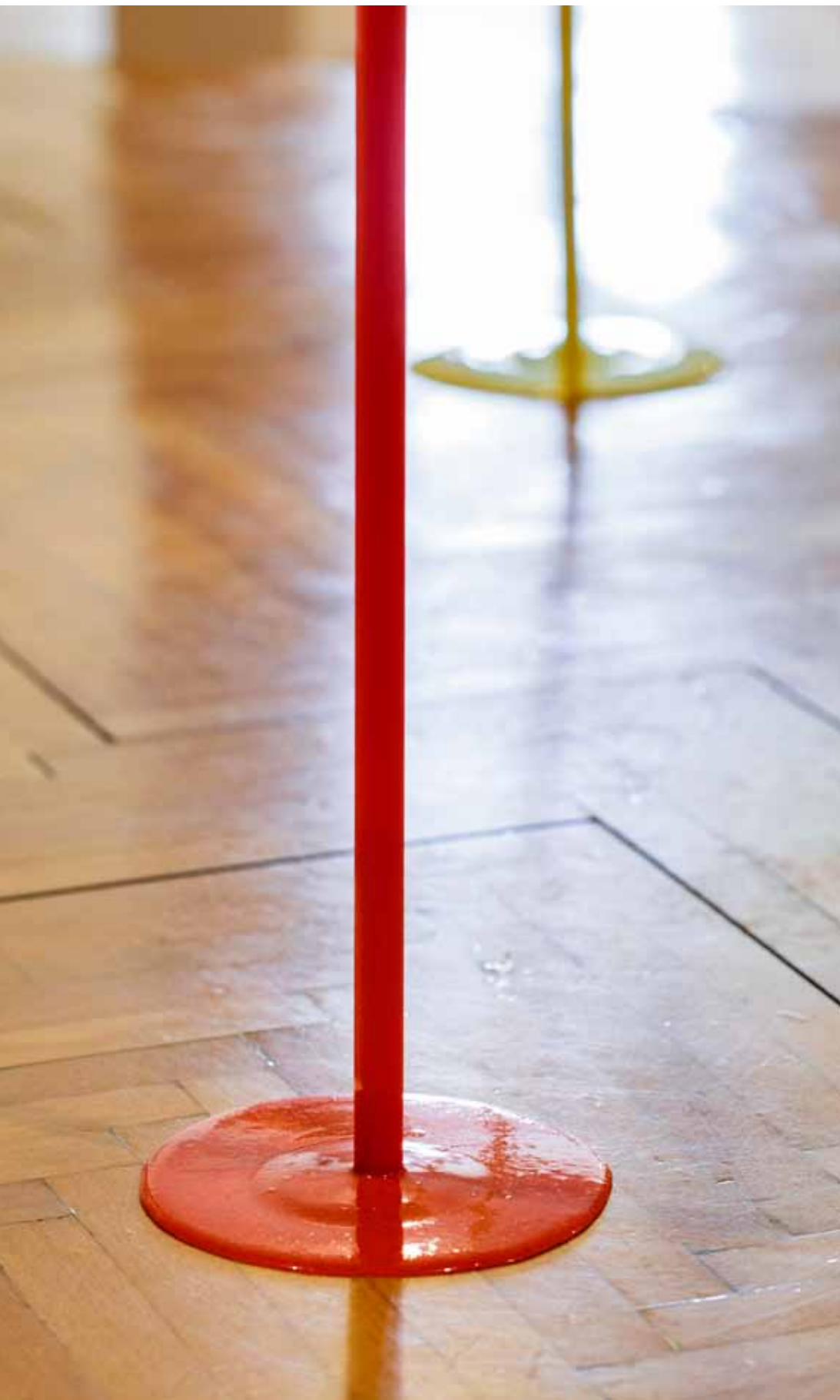
Kapi / Drops epoksid, pleksiglas / epoxide, plexiglass, dimenzije promjenjive / variable dimensions , 2017. detalj / detail